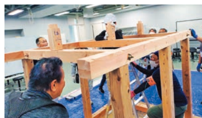
キッズジョブよこすか