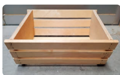
フラワーボックス