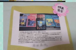
校長先生のおすすめ本も☆