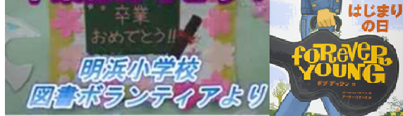
図書ボラからのメッセージ