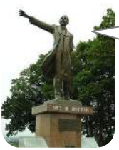
羊ヶ丘のクラーク博士像