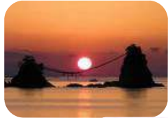
二見ヶ浦の夫婦岩