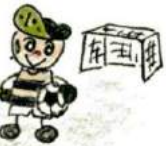
鹿島サッカースタジアム